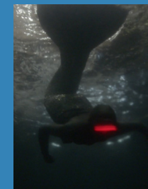
Still von „Sirenomelia“ (2017).

21.04. | Sonntag | 15:00 – 16:00 Uhr | dialogischer Ausstellungsrundgang auf Deutsch / 7€